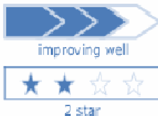
Tav. 3. Lo scoring delle performance degli enti locali: il significato delle stelle.

Scoring: 4 = well above minimum requirements - performing strongly 3 = consistently above minimum requirements - performing well 2 = at only minimum requirements - adequate performance 1 = below minimum requirements - inadequate performance